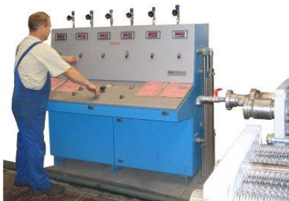
Banco de pruebas hidráulico para packs de placas reacondicionados