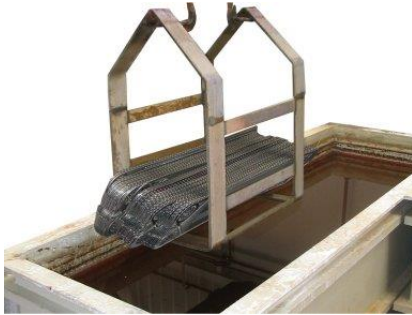
Cleaning of fouled plates