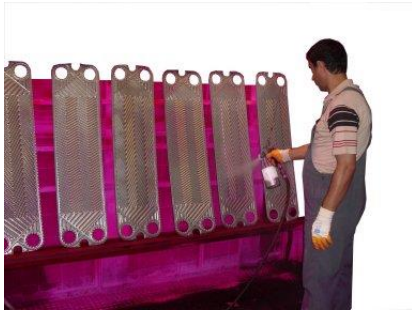
Examen de placas limpiadas (Metal Check)